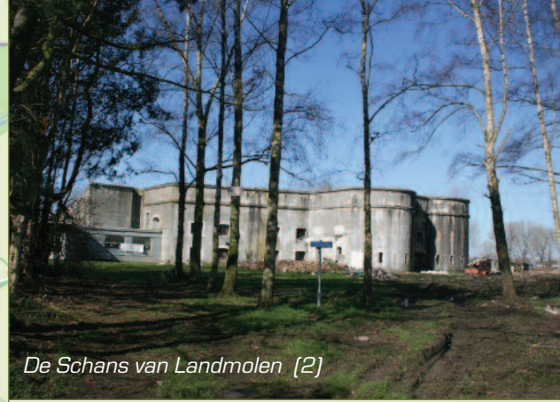
De Schans van Landmolen [2]

De rode stippellijnen zijn dreven of onverharde paden. De zwarte lijnen zijn meestal smallere asfaltwegen. De groene stippellijn is een verkorting.