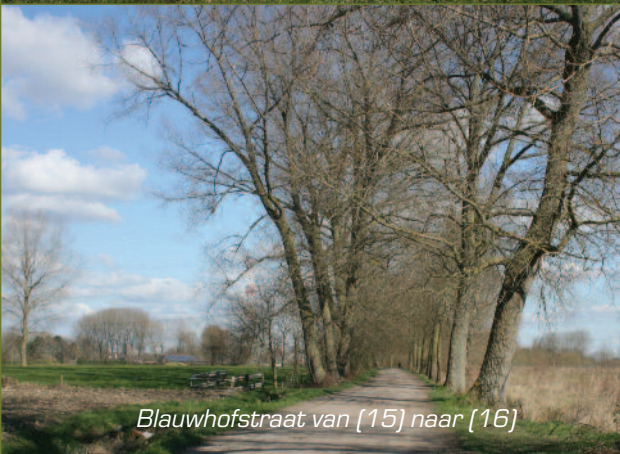
Blauwhofstraat van [15] naar [16]