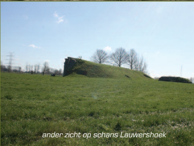
ander zicht op schans Lauwershoek