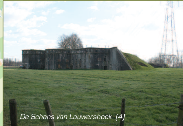
De Schans van Lauwershoek [4]

De Schans van Landmolen werd samen met de Schans van Lauwershoek gebouwd in 1909-1912 tussen het Fort van Steendorp en het Fort van Haasdonk. Vandaag is het domein privébezit en is het dus niet toegankelijk. Meer dan 100 jaar na de bouw is de Schans van Lauwershoek nog steeds intact. Het domein wordt alleen gebruikt voor de zendmast die er staat en is toegankelijk. Het gebouw zelf is afgeschermd met prikkeldraad. Onderaan: zicht op het fort van Steendorp, ooit gebouwd in baksteen !