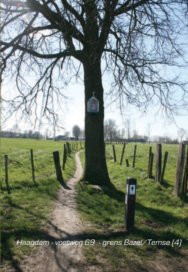
Haagdamburg - voetweg 69 - grens Bazel/Temse (4)