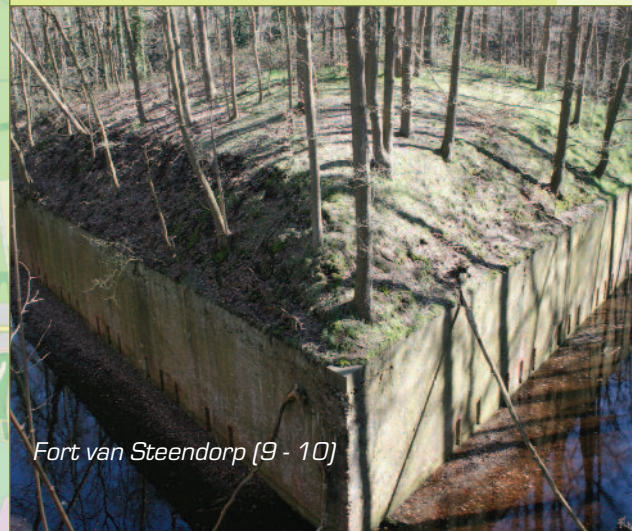
Fort van Steendorp [9 - 10]

De Schans van Landmolen werd samen met de Schans van Lauwershoek gebouwd in 1909-1912 tussen het Fort van Steendorp en het Fort van Haasdonk. Vandaag is het domein privébezit en is het dus niet toegankelijk. Meer dan 100 jaar na de bouw is de Schans van Lauwershoek nog steeds intact. Het domein wordt alleen gebruikt voor de zendmast die er staat en is toegankelijk. Het gebouw zelf is afgeschermd met prikkeldraad. Onderaan: zicht op het fort van Steendorp, ooit gebouwd in baksteen !