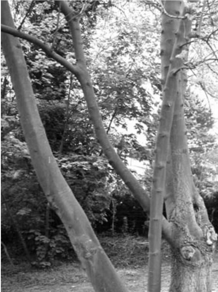
De Es

werden de twee helften van de es weer verbonden. Als de es zich goed herstelde, zou ook het kind weer genezen.