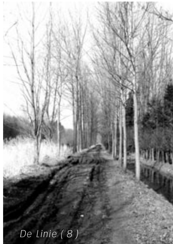
De Linie ( 8 )