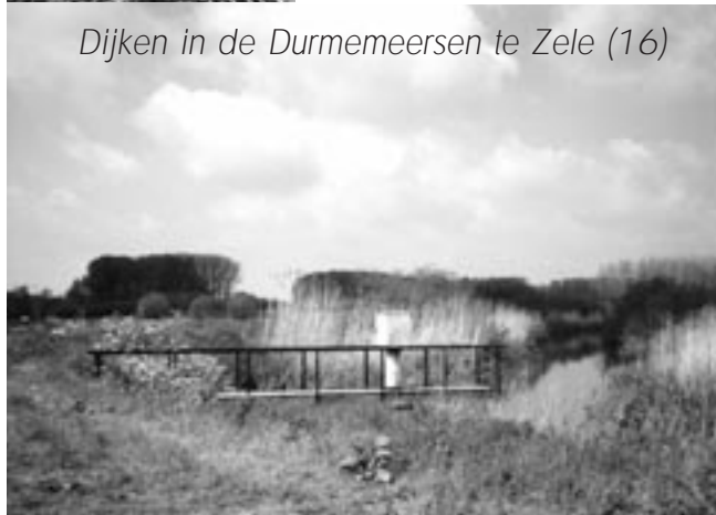
Dijken in de Durmemeersen te Zele (16)