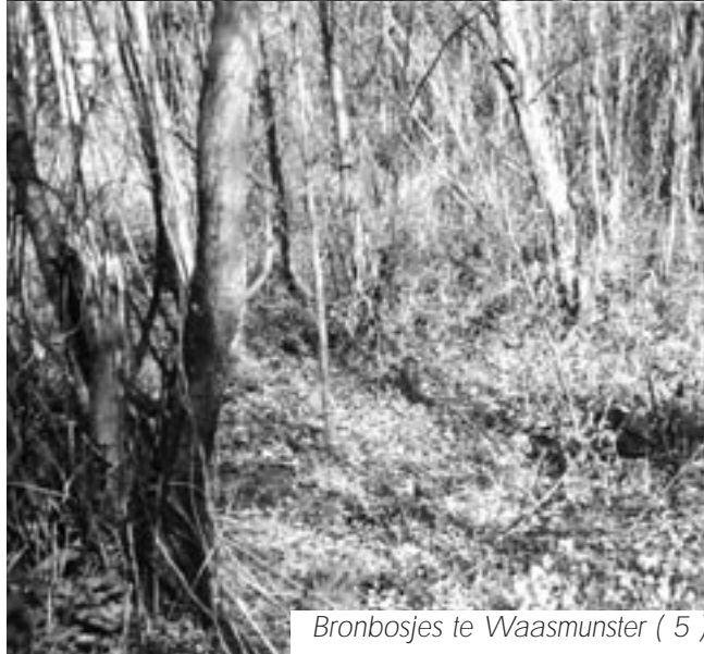
Bronbosjes te Waasmunster ( 5 )