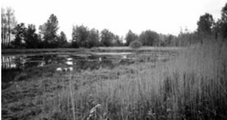
De Lokerse Moervaartmeersen ( 11 )

grootste realisaties zijn de inrichting van de bezoekercentra Molsbroek en Donkmeer, met jaarlijks tienduizenden bezoekers en meer dan 300 geleide bezoeken. Daarnaast is er door de afdeling Waasmunster een grote milieumediatheek, met meer dan 3000 titels, ingericht in het kasteel Blauwendael.