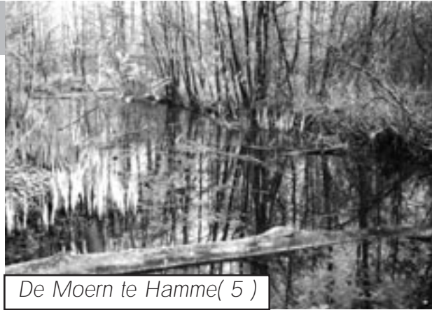
De Moern te Hamme ( 5 )

De regionale vereniging voor natuur- en milieubeheer vzw Durme is 34 jaar geleden opgericht door enkele natuurliefhebbers en ringers van vogels. Die stichters zagen toen zoveel onbesproken natuurverloedering en milieuvuiling, zoveel onbegrip bij politici en zoveel gebrek aan ruimtelijke ordening dat ze besloten een vereniging op te richten om in de Durmestreek het tij te doen keren.