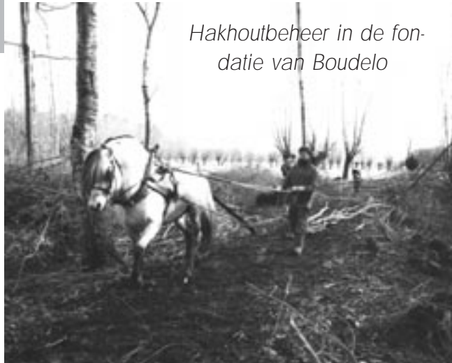
Hakhoutbeheer in de fon- datie van Boudelo