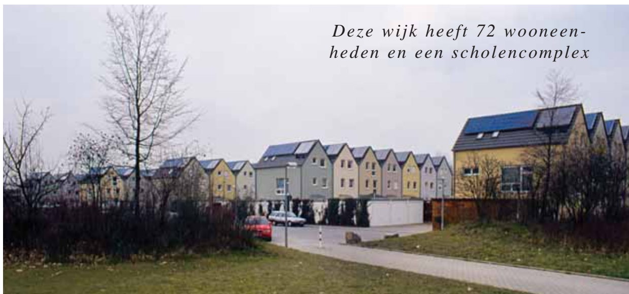
Deze wijk heeft 72 wooneenheden en een scholencomplex