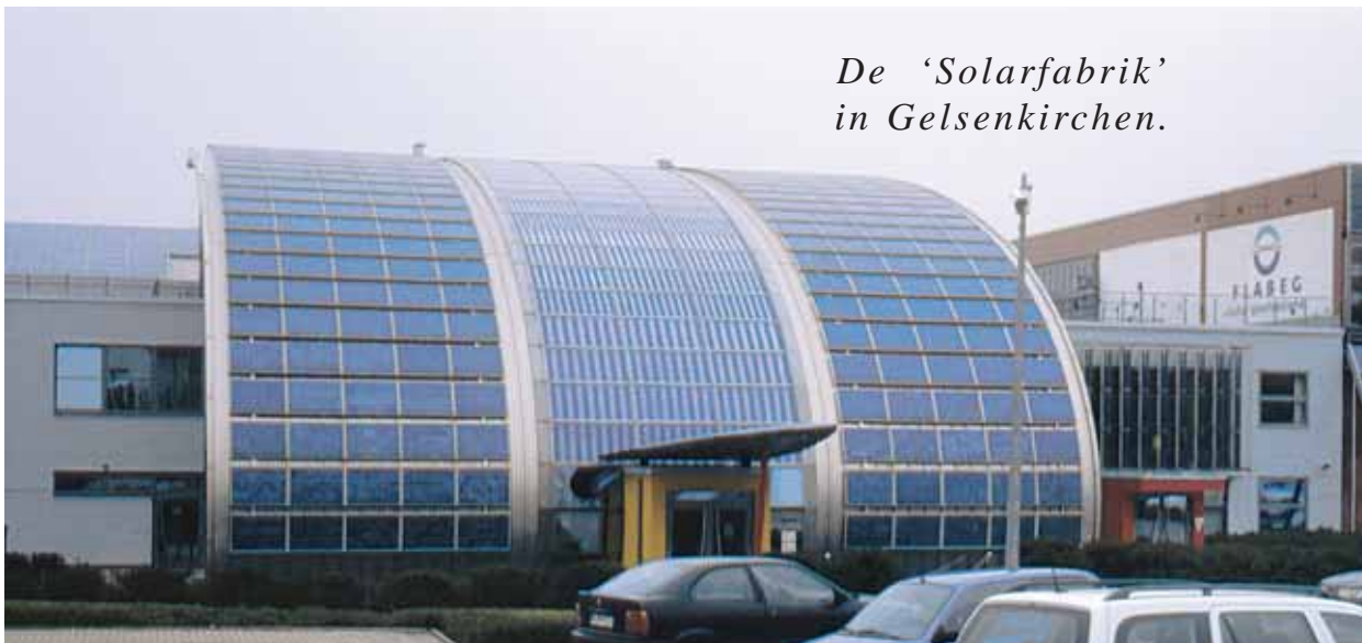
De 'Solarfabrik' in Gelsenkirchen.

Verder hebben we in Gelsenkirchen de Solarsiedlung Gelsenkirchen-Bismarck bezocht. Deze zonnewijk omvat 72 wooneenheden, waarvan de meeste naar het zuiden gericht zijn, en een groot scholencomplex. Zonnecollectoren zorgen voor 65% van het warme water en 40% van de nodige elektriciteit wordt opgewekt door PV-panelen. Dit project toont duidelijk aan dat zonnearchitectuur en zonne-stedenbouw best mooi kan zijn. De gids merkt op dat er meer energie nodig was om de, in oppervlakte beperkte, wegen te maken dan dat er nodig was om de huizen te bouwen. Dit is een opmerking waar zeker op het platteland rekening mee kan gehouden worden: de riolering en regenafvoer kan dus immers beter niet onder de wegen worden gestopt. De school valt op door het mooie volumespel. Het hout waarmee de school is betimmerd staat zo in verschillende gradaties bloot aan zon, weer en wind. Dit werd duidelijk aan houten delen. Het is duidelijk dat bij de bouw van de school rekening is gehouden met de bescherming van het hout door het op een bepaalde manier in de constructie toe te passen. Dit noemt men constructieve houtbescherming; hierover publiceert VIBE vzw binnenkort trouwens een handboek. Vijf rijwoningen zijn bepleisterd in vijf verschillende kleuren met als resultaat een mooie pastelkleurige 'regenboog'. Auto's staan geparkeerd onder een pergola