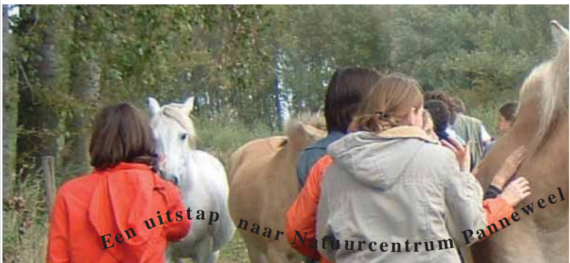
Een uitstap naar Natuurcentrum Panneweel

s'Middags, toen we onze boterhammen opaten, hebben we ons kapotgelachen en onze laatste adem in een ballon geperst, zodat we de witte ballonnen aan onze fiets konden hangen ( zodat