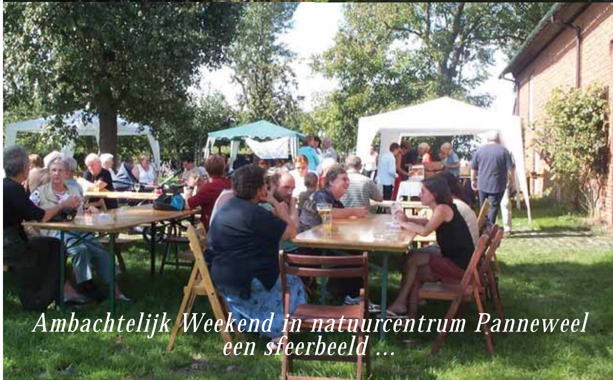
Ambachtelijk Weekend in natuurcentrum Panneweel een sfeerbeeld ...