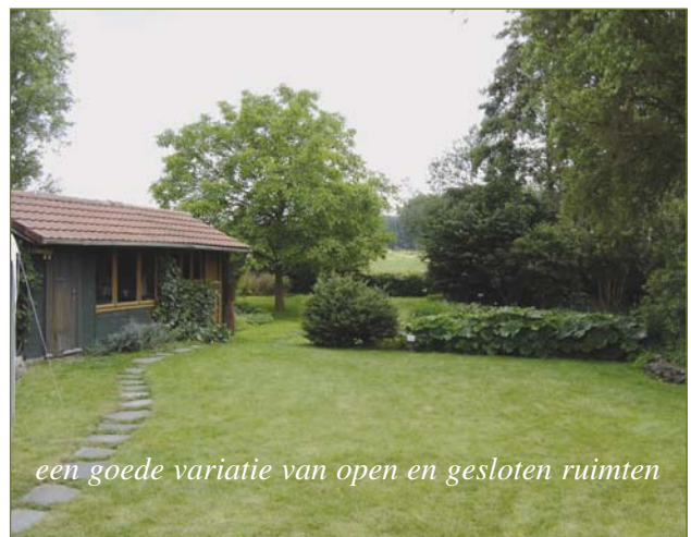
een goede variatie van open en gesloten ruimten

nen uitzien: stel dat je om een of andere reden niet meer in staat bent in de tuin te werken en je laat twee à drie maal per jaar iemand een paar fundamentele beheerswerkjes uitvoeren, dan zou je tuin, ondanks deze minimale zorgen, toch stand moeten houden.