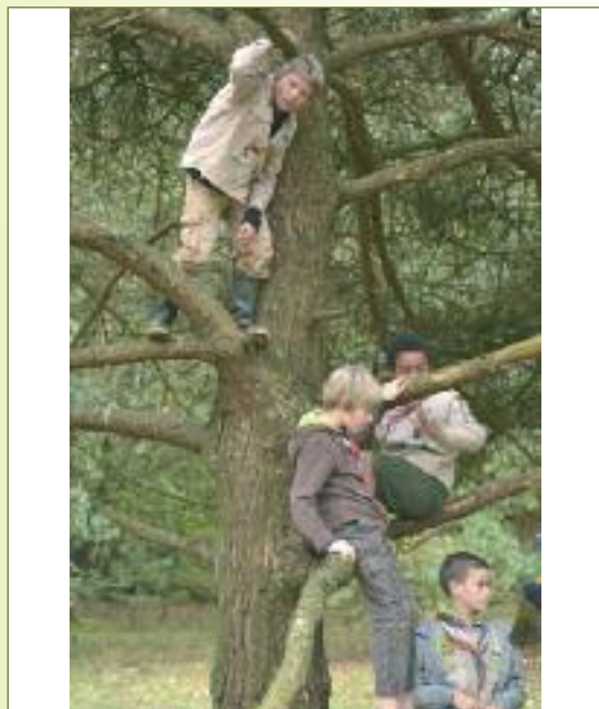
De klimbomen werden getest en goedgekeurd door ervaren professionele klimboomtesters.