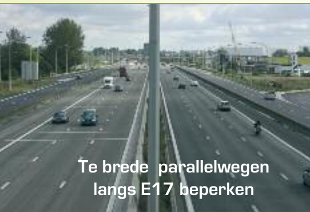
Te brede parallelwegen langs E17 beperken

De burgemeesters willen de (Sint-Niklase) parallelwegen langs de E17 aanleggen tot aan de Kruibekesteenweg. ABLLO pleit ervoor om die parallelwegen zo beperkt mogelijk aan te leggen. Van Sint-Niklaas tot hoogstens Haasdonk, maar niet tot de Kruibekesteenweg.