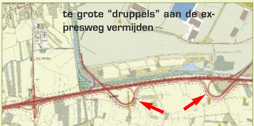
te grote "druppels" aan de expresweg vermijden