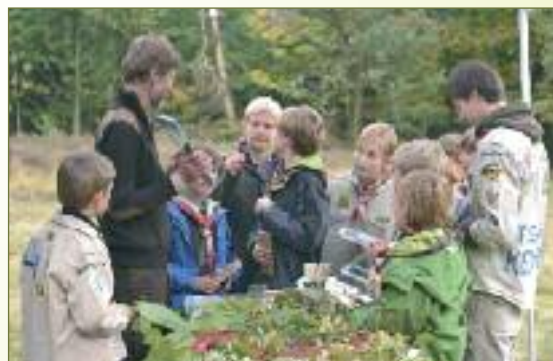
Er viel ook wat spelenderwijs bij te leren op de stands van ANB, Natuurpunt en Regionaal Landschap Schelde-Durme.