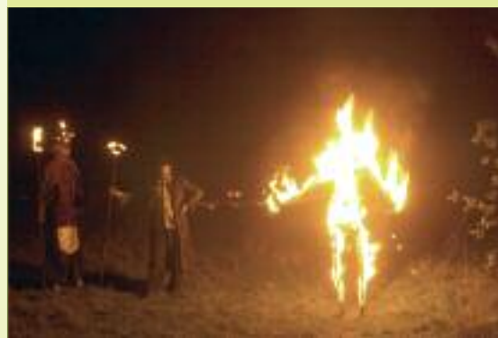
En toen het donker werd, werd de vuurplaats ingehuldigd door Sigmund en zijn vrienden, de Vuurmeesters.