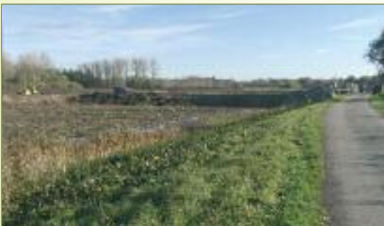
De aanleg van het bekken in het Klein Broek in Elversele nadert zijn voltooiing. In dit bekken zal de baggerspecie uit de Durme tussen de Vlierbeek en de Mira-brug ontwaterd worden. Maisakkers en weiden zullen op termijn verdwijnen. Zolang de ontpoldering echter niet start, kunnen de landbouwers hun gronden blijven gebruiken.