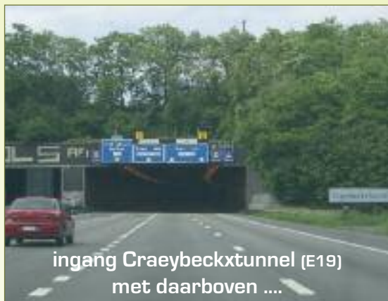
ingang Craeybeckxtunnel (E19) met daarboven ....

Deze zone kan ook worden overkapt tot Merksem (6km) als het Meccanotracé wordt gekozen. Maar NIET als men vasthoudt aan BAM! En het totale prijskaartje valt enorm mee!!