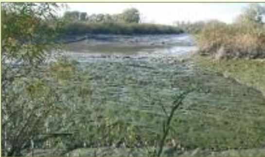
De Durme ter hoogte van de Vlierbeek te Tielrode. Er wacht nog een enorme hoeveelheid slib om verwijderd te worden.