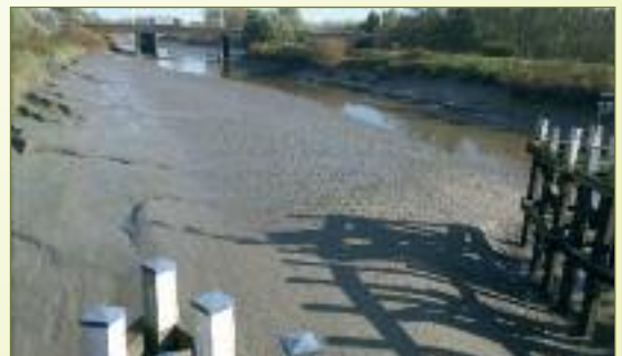
De verzanding in de Durme neemt gigantische proporties aan. Ter hoogte van de Mira-brug vormt zich een grote zandbank achter het staketsel van de brug.