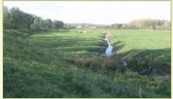
Klein Broek Elversele, met op de achtergrond het zanddepot. Ter hoogte van de ontwateringssluizen komt er een bres in de dijk. Het grachtenstelsel zal de basis vormen van het nieuwe krekensysteem in de schorren die na de ontpoldering zullen ontstaan.