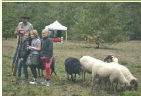
Van oudsher horen herders met schapen en een herdershond thuis op de heide.