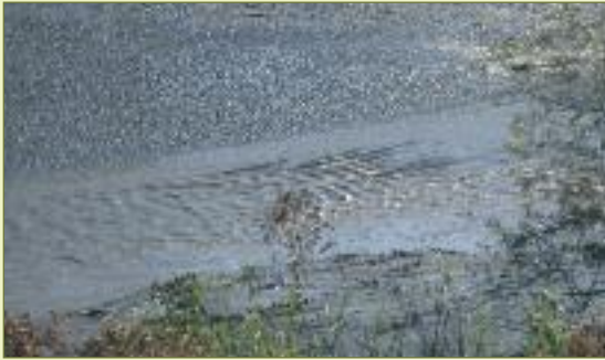
Laag water op de Durme ter hoogte van de brug van de N-41.