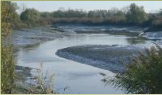
De impact van de baggerwerken is duidelijk te zien. Op de plaats waar gebaggerd werd is de Durme bij laag water vier keer breder dan in het ongebaggerd gedeelte.