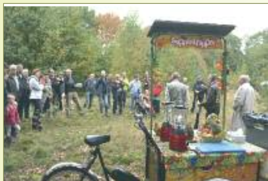
Na de officiële opening van de Vaag kon je bij de Sappentrappen je eigen gezonde sapje trappen voor de fruitige receptie.