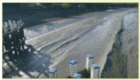
De noodzaak voor baggeren is op deze foto duidelijk te zien. Bij laag water loopt de Durme bijna leeg. De golven verraden dat het water nog net over de bodem schuurt.