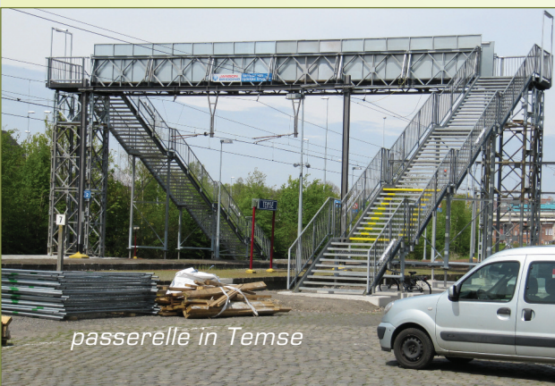
passerelle in Temse