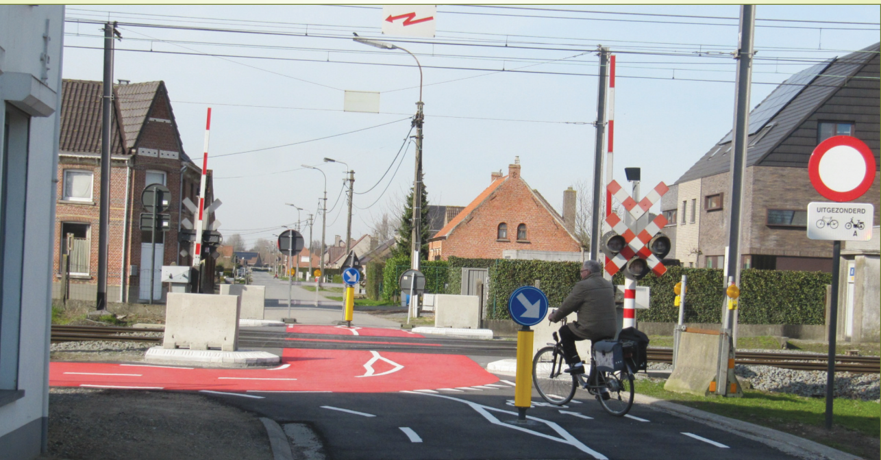
vernieuwde overweg te Zeveneken

station Sinaai, Belsele, Nieuwkerken-Waas en Zwijndrecht dienen eerder aangepakt te worden dan deze van de Oude Heerweg te Lokeren (werken starten dit jaar). Bijvoorbeeld om de trein in het station met zekerheid te kunnen halen. De fiets snelweg F4, Antwerpen - Gent, gaat op het traject Lokeren - Sint-Niklaas drie maal over een overweg. Dit zijn zwakke schakels in het fietsnetwerk. Bijhorende schets toont een oplossingsrichting aan de Kleemstraat te Belsele zonder dure bruggen of tunnels. De schets stelt voor om het