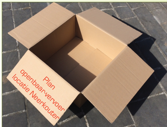
Bijna geen enkele buslijn bedient nu de 'nieuwe' locatie Neerkouter. En een openbaar-vervoerplan daarvoor is een lege doos.