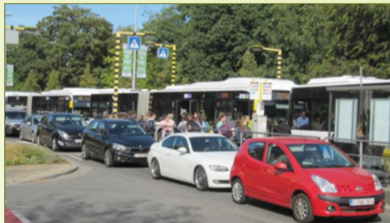
Bijna alle Wase buslijnen bedienen nu de Parklaan, de huidige locatie van AZN..

Sint-Niklaas. Tijdens de gemeenteraad van 21 juni 2019 stelde een raadslid vragen over kostprijs en kwaliteit van het openbaar vervoer bij de bediening van de nieuwe stek van AZ Nikolaas op de 'hoek van de westelijke ringweg en Heimolentraat'. ABLLO had berekend, dat een nieuwe lijn ruim 1,1 miljoen EURO per jaar extra kost aan De Lijn. En de gebruiker krijgt slechtere verbindingen (zie 'tGV nr. 212 van mei 2019 op p. 24).