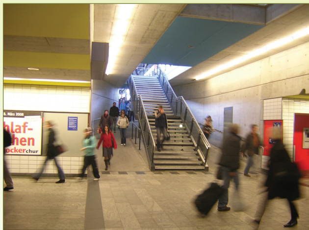
Chur, met helling en trap vlotte overstap.