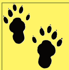
Een afdruk van een otter of wolf of ...

Theorie: vrijdag 11 en 18 februari CC De Kouter Koutermolenstraat 8b 9111 Belsele, telkens vanaf 19u.