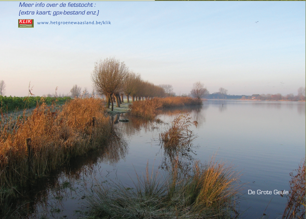
De Grote Geule