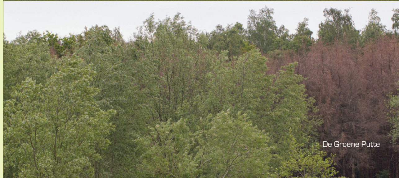
De Groene Putte