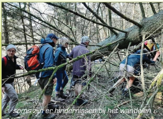
soms zijn er hindernissen bij het wandelen

De Voer, IJse en Dijle meanderen in het Brabants plateau ten zuid- westen van de immer drukke studentenstad Leuven. Maar tussen Bertem, Loonbeek en de 'DoodeBemde' is het één en al rust en natuur! Afspraak: 9.30 uur aan de kerk van Korbeek-Dijle (parkeergelegenheid in de omgeving). Inschrijven bij freddy.moorthamer@skynet.be of 0475 923484.