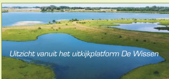
Uitzicht vanuit het uitkijktplatform De Wissen

We wandelen die morgen in het natuurgebied Negenoord-Kerkeweerd langs waterplassen die ontstonden door ontgrinding. Ze zijn in de winter altijd druk bevolkt door watervogels. Smienten overwinteren er in grote aantallen. Talloze steltlopers doen het daar ook goed. Er broeden verschillende koppels ijsvogels. Allicht zien we sporen van bevers.