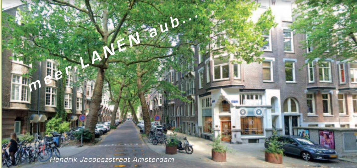
Hendrik Jacobszstraat Amsterdam