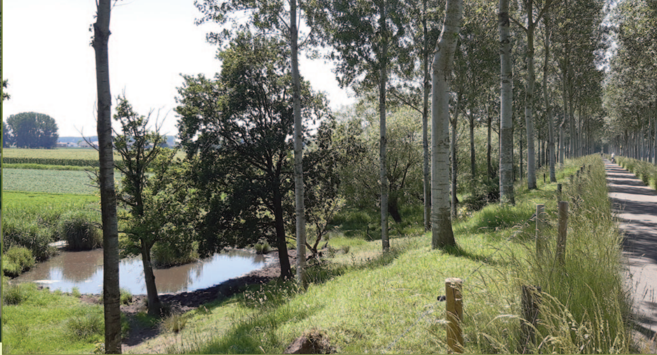
De Koningsdijk in de richting van De Klinge, met aan de linkzijde de langgerekte waardevolle brede rietkraag, die wettelijk beschermd is

Omdat rietkragen bij wet beschermde vegetaties zijn, werd er recent een veetunnel geplaatst. Koeien kunnen zo makkelijker van de ene naar de andere zijde zonder overlast voor wandelaars of fietsers te veroorzaken. Zo vermindert de begrazingsdruk op de rietkraag wat van belang is voor het herstel ervan. De veetunnel werd geplaatst ter hoogte van een bestaande dijkdepressie, waar het fietspad een duik maakte. Het plaatsen van de veetunnel werd ook aangegrepen om het historische dijklichaam in zijn oorspronkelijke toestand te herstellen. Ook het fietspad is opnieuw hersteld. Binnenkort wordt een infopaneel geplaatst voor de